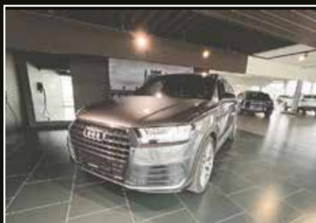
Audi Q7 TDi 272 quattro Tiptr.