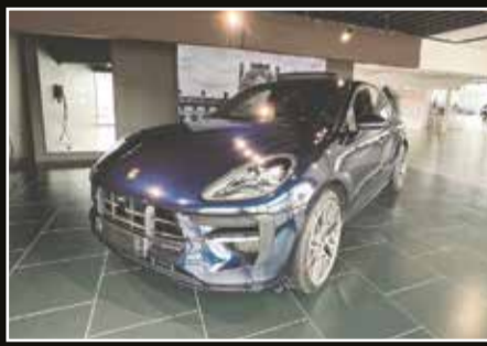
Porsche Macan GTS PDK