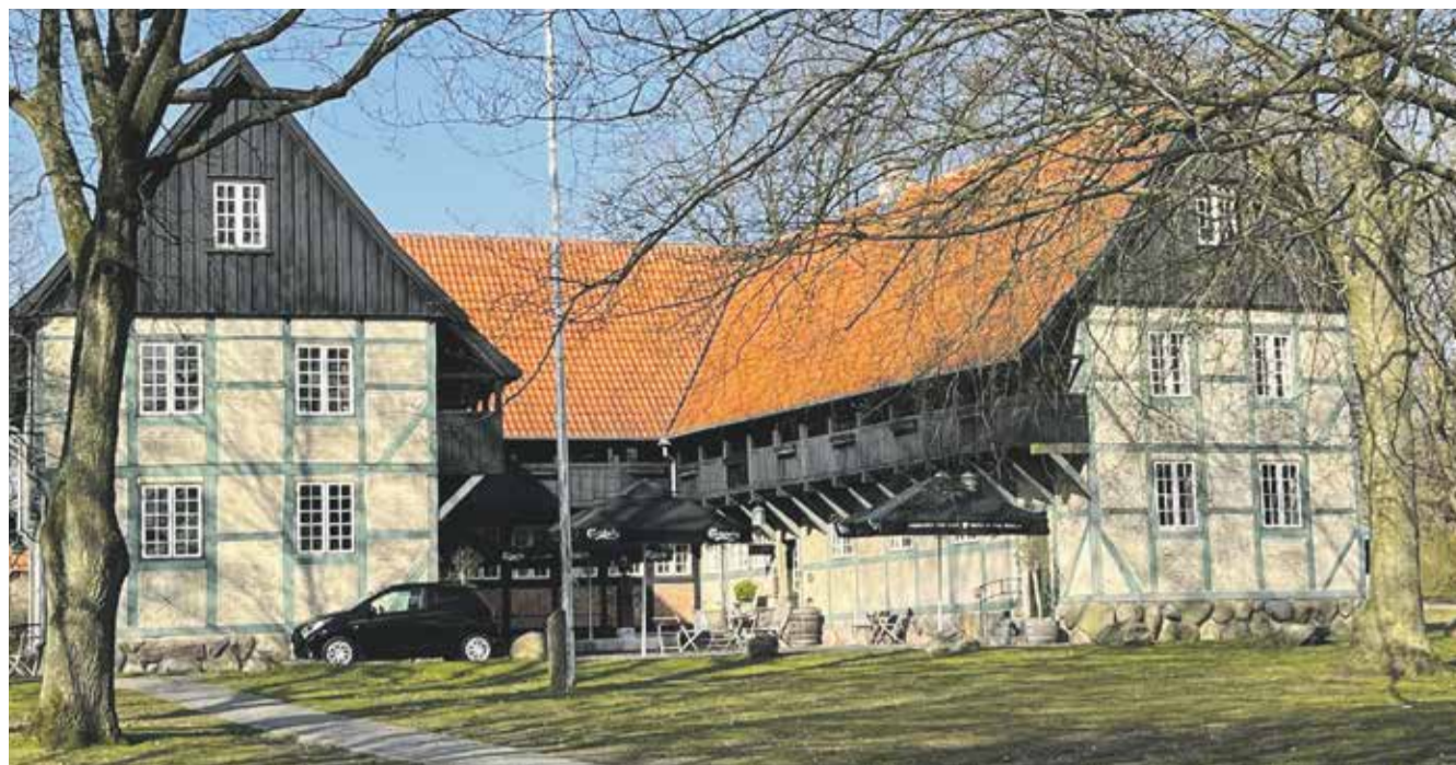
I 1952 var 1600-tals købmansgården fra Nytorv, Mønstedes Gård, blevet flyttet til Hasseris. Den blev omdøbt til Svalegården og lagde navn til Svalegårdsvej, der før da hed Hundeklemmen. Her holdt sognerådet møder fra 1952-1970.