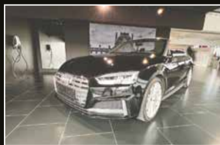
Audi S5 TFSi Cabriolet quattro Tiptr.