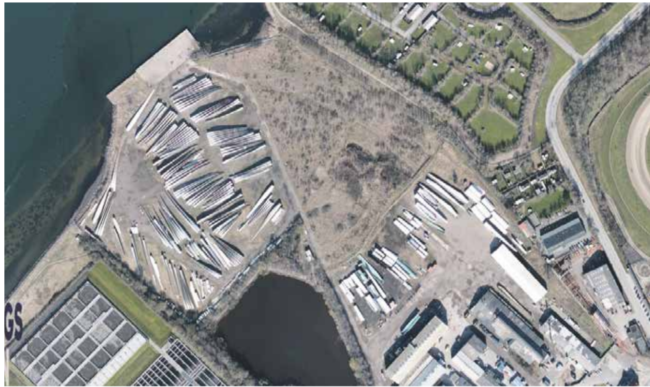
Den store industrigrund ned mod Limfjorden skal bebygges med boliger, butikker og kontorer, hvis det står til ejerne.

I et høringssvar til Helhedsplanen for Vestbyen advarer Aalborg Forsyning imod, at der åbnes op for boliger og butikker på Nordens grund i Mølholm, sådan som ejeren af Nordens grund, Mølholmparken A/S, ønsker.