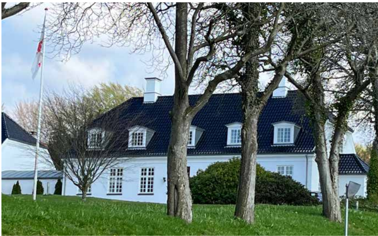
Mellem 1918 og 1952 fungerede den skolebygning, som blev opført, som såkaldt pogeskole i 1918 på Hasserisvej, og siden fungerede den som kommunekontor indtil 1958 og som mødested for sognerådet.

I Hasseris var der dog hverken borgmester eller byråd, men derimod en sognerådsformand og et sogneråd. Når man anvendte ordet rådhus, var det udtryk for en stærk trang til at være en selvstændig by i stedet for at være forstad til Aalborg. Hvordan det ellers kom til