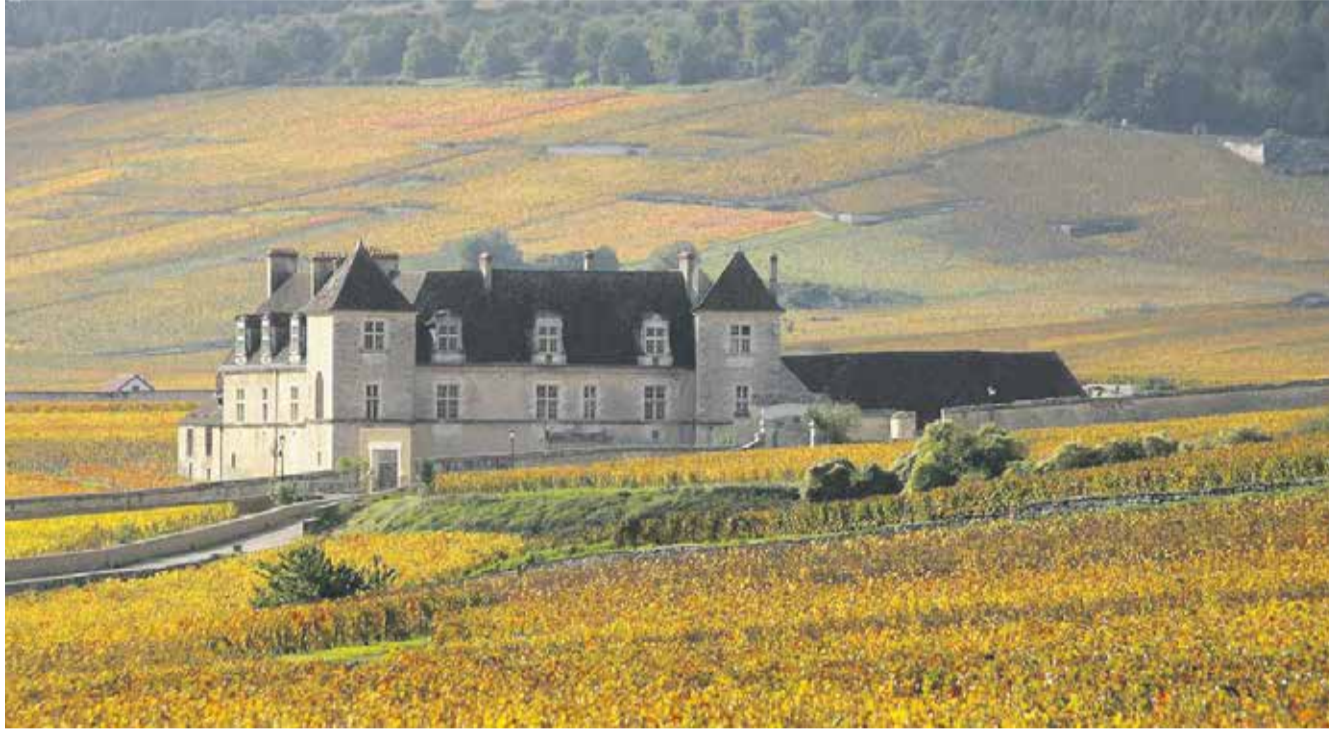
Alle 13 vine kommer fra marken Clos de Vougeot, som oprindeligt blev inddelt i parceller af cisterciensermunkeordenen omkring år 1000.

En af de helt store aftener til Nordjysk Madfestival 2023 giver ægte vinentusiaster mulighed for at slynge bourgogne i glassene til en helt unik kommenteret smagning på Aalborg Kloster.