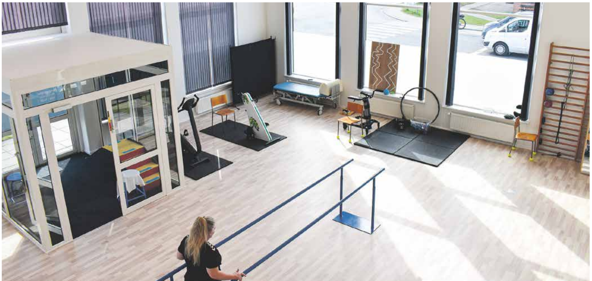
Et kig i de lækre højloftede lokaler på Nibevej i Skalborg.

de 6000 kr. værd, som jeg ville få på kontanthjælp. Så jeg blev raskmeldt efter 17 dage, fordi jeg ikke ville sidde derhjemme og acceptere det."