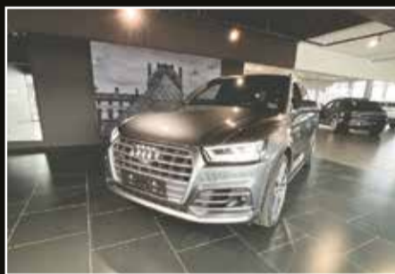
Audi SQ5 TFSi quattro Tiptr.