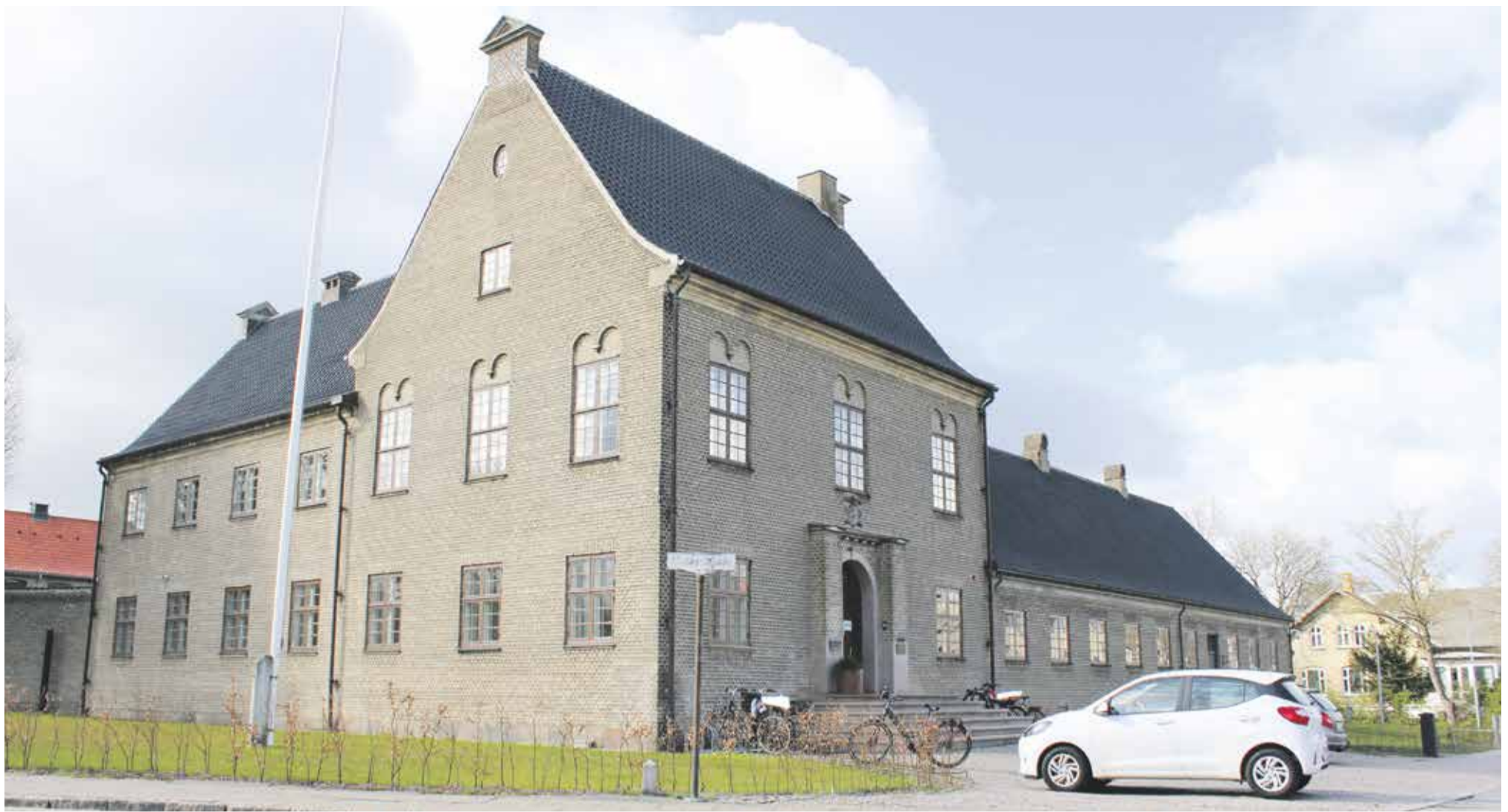
Arresten i Kong Hansgade, som den ser ud i dag.