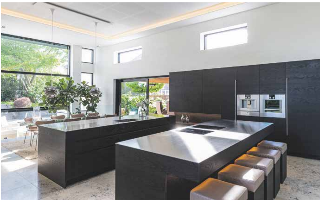
Eksempel på et Biform køkken, designet af indretningsarkitekt Lars Riise Simonsen.

I rundvisningen på fabrikken bliver det tydeligt, at intet er overladt til tilfældighederne,