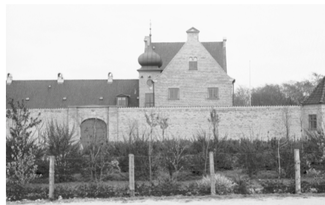
Arresten i Kong Hansgade, tilbage i 1920'erne.