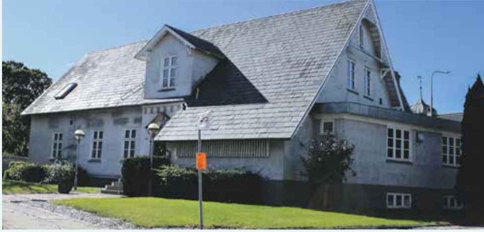
Den eksisterende ejendom, der ønskes nedrevet og erstattet af et 4-etagers boligbyggeri.

Et støjnotat, udarbejdet af SWECO for Logen Den Kubiske Sten, viser, at det planlagte byggeri vil blive udsat for sundhedsskadelig trafikstøj.