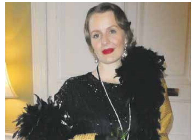
Hvordan gik din mor og bedstemor klædt?

Zonta er en international organisation (NGO), der støtter kvinder internationalt, nationalt og lokalt. Aalborg Zontaklub har tidligere støttet lokalt bl.a. Reden Aalborg, Aalborg Krisecenter og Mødrehjælpen, Aalborg. Læs mere om Aalborg Zontaklub på https://aalborg.zonta.dk/