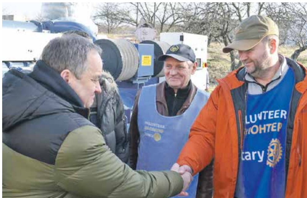
Den tredje generator blev leveret i Mykolaiv, Ukraine.

De 20.000 kr., som Aalborg Søndre Rotary Klub har indsamlet til projektet, er samlet ind dels via klubbens kontingent, via donationer fra klubbens medlemmer og via en indbringende auktion til klubbens julefest.