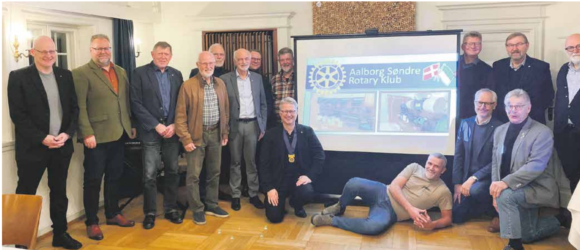
Aalborg Søndre Rotary Klub mødes på Svalegården hver mandag kl. 17.15