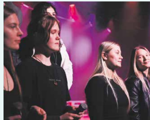
Kor og band er godt i gang med at øve.

En ung drømmer, kaldet Galileo Figaro, bliver ledt til rebellerne, og han slutter sig til dem i kampen for at finde den forsvundne rockmusik og de selvstæn-