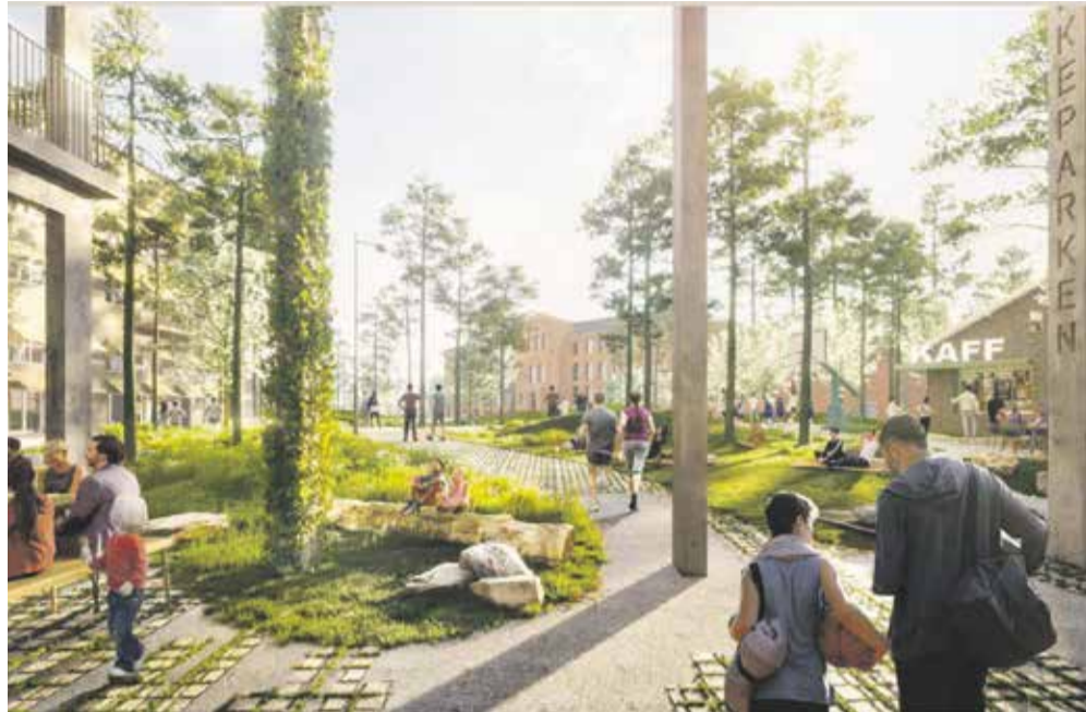
Et "view" ind i arkitekternes vision for området.