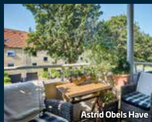
Astrid Obels Have