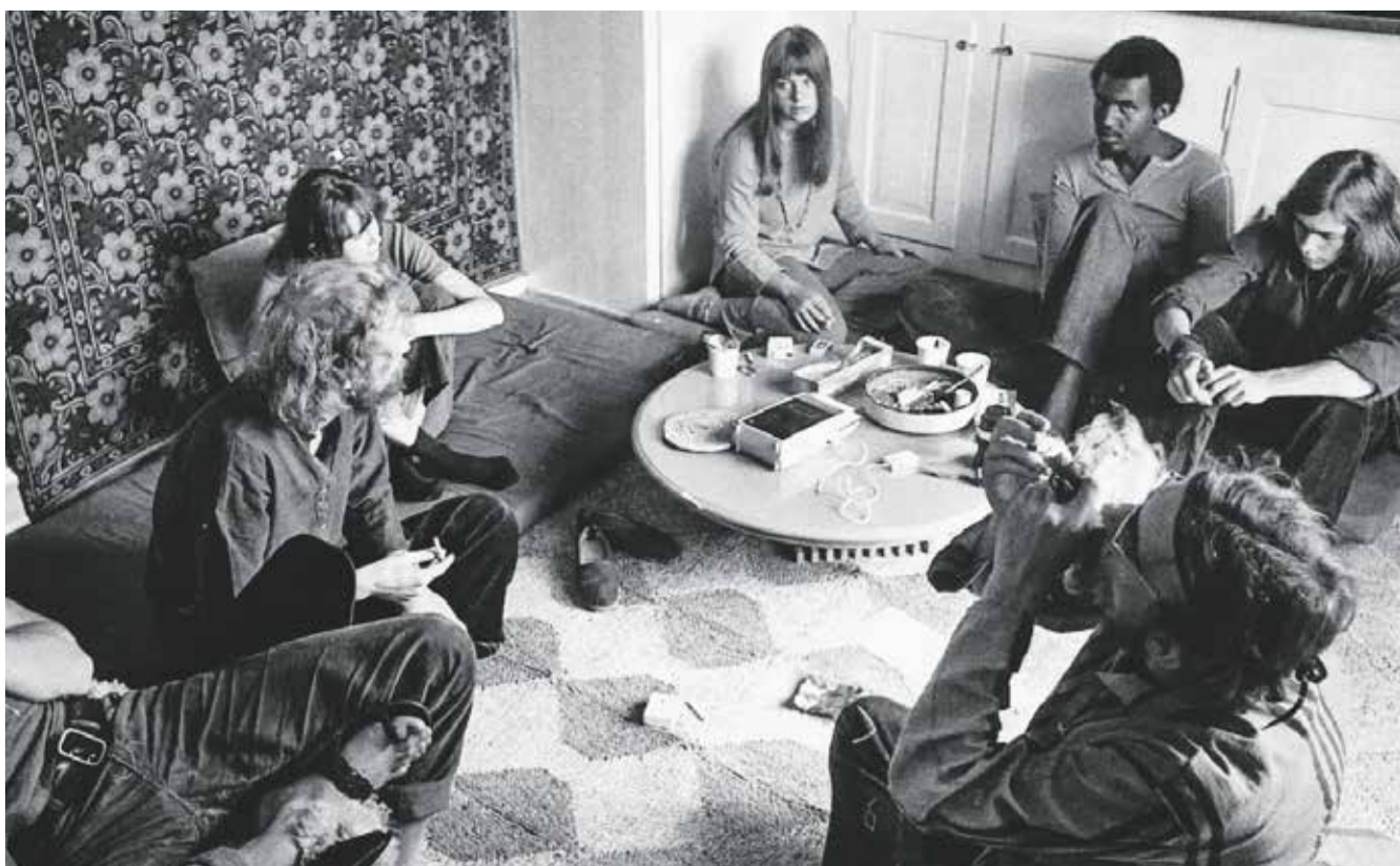
Hippimiljøet på Egevej 7 ca. 1970.

Vi har også talt med Lone Bornefelt, som er datter af