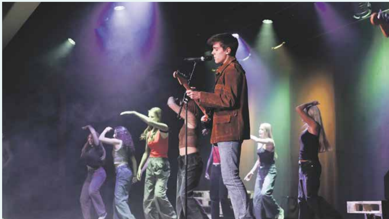
Eleverne står selv for at lave koreografi til dansenumrene i forestillingen.

I perioden 7.-10. februar opføres årets musical We Will Rock You på Hasseris Gymnasium.