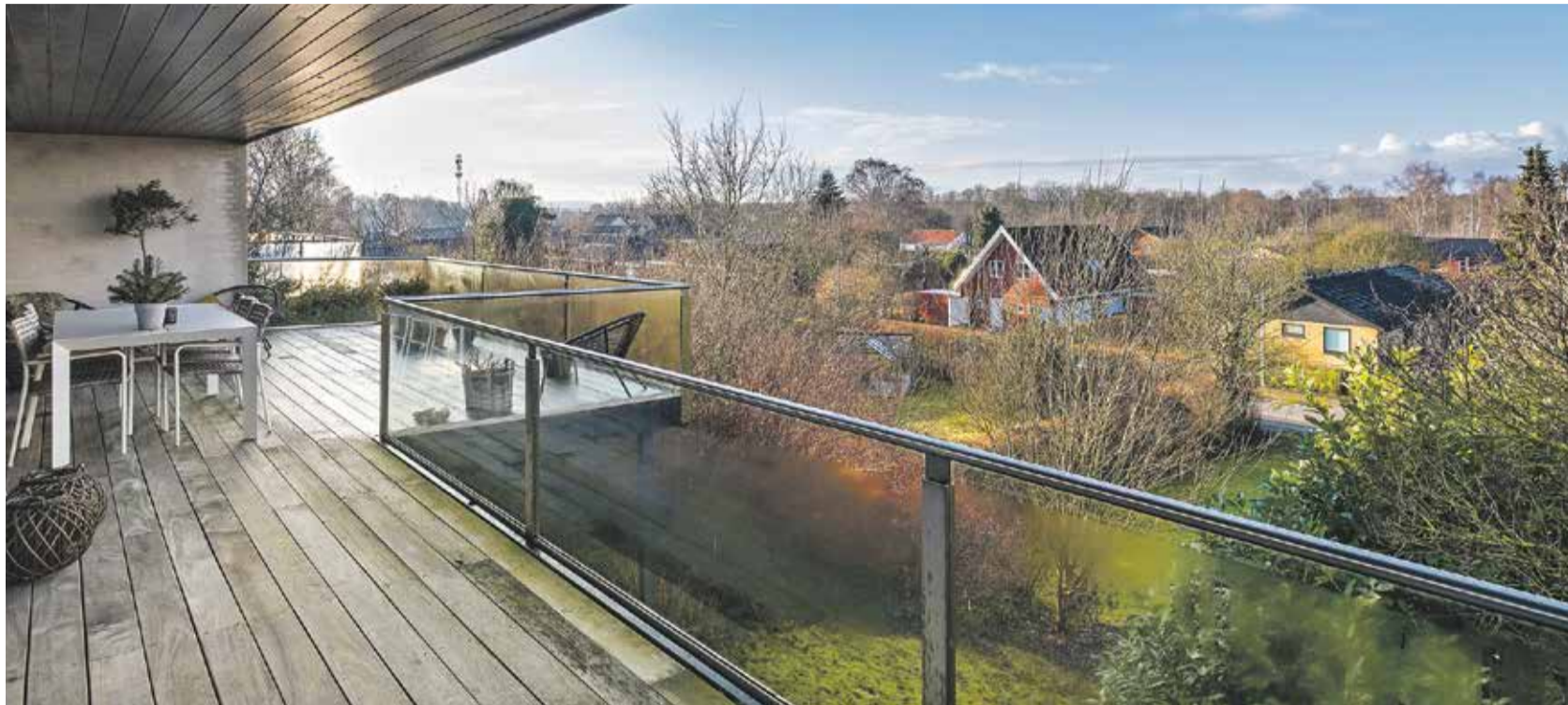
Enestående villa på 311 etagemeter på toppen af Hassseris med 360 graders udsigt.

Det bedste ved huset er, at det er lyst og luftigt, den dejlige beliggenhed og panorama-udsigten mod fjorden,” lyder det fra sælger.