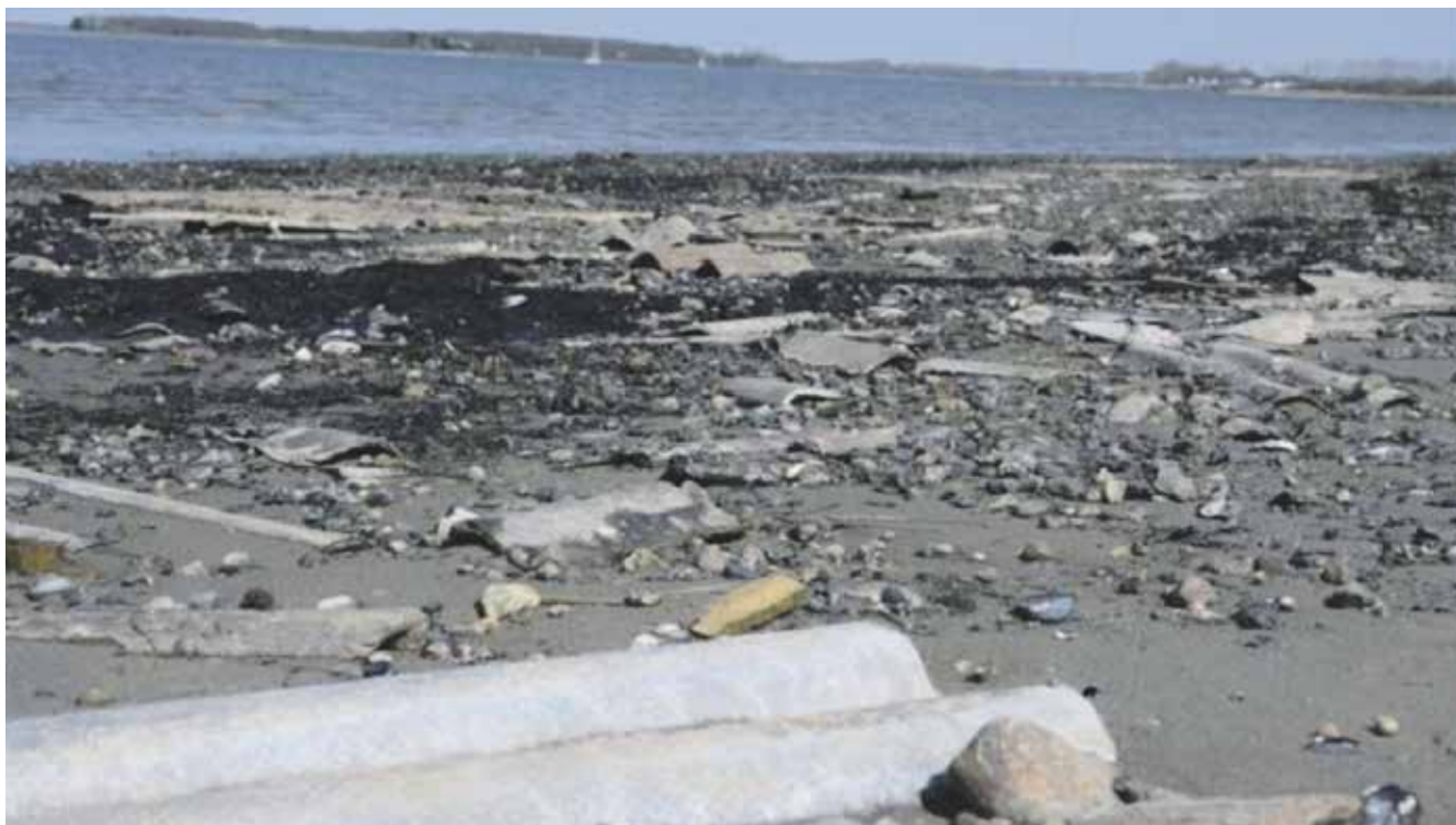
Asbestforureningen på området ved Mølholm.