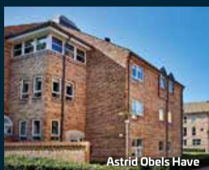
Astrid Obels Have