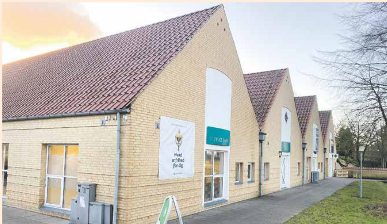
De gule murstensbygninger overtages helt af COOP