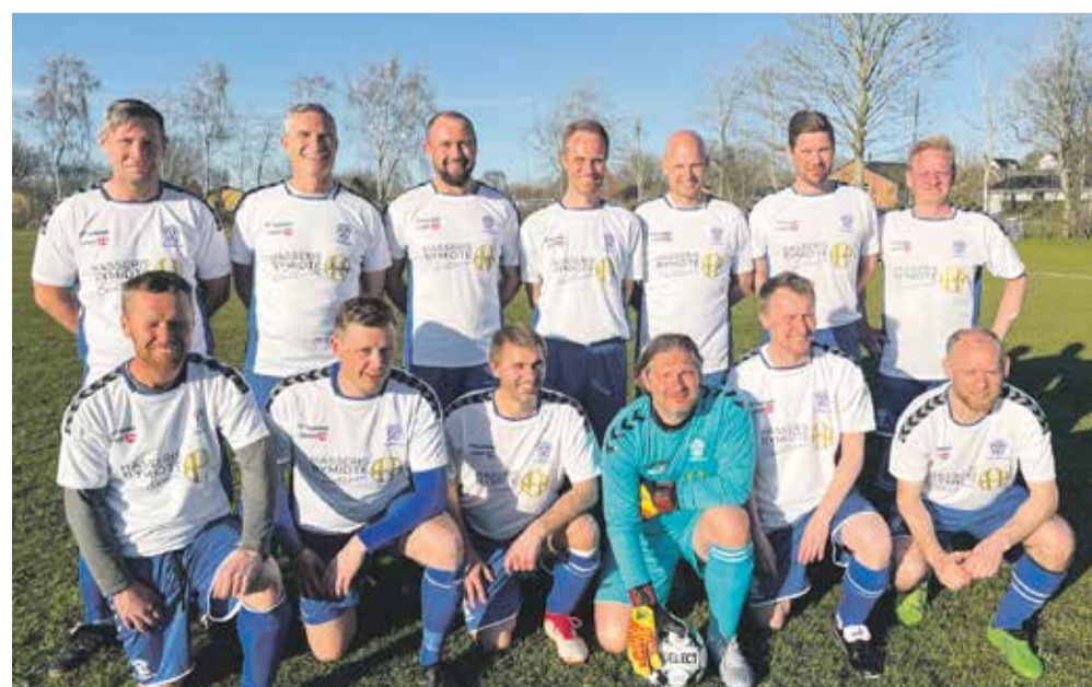
Her ses de stolte jyske Mestre i deres nye spillersæt fra Hasseris Bymidte.