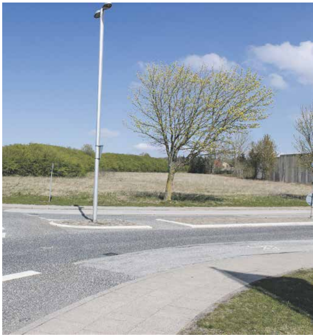
Hjørnet af Bejsebakkevej og Skelagervej, hvor den nye institution skal ligge.