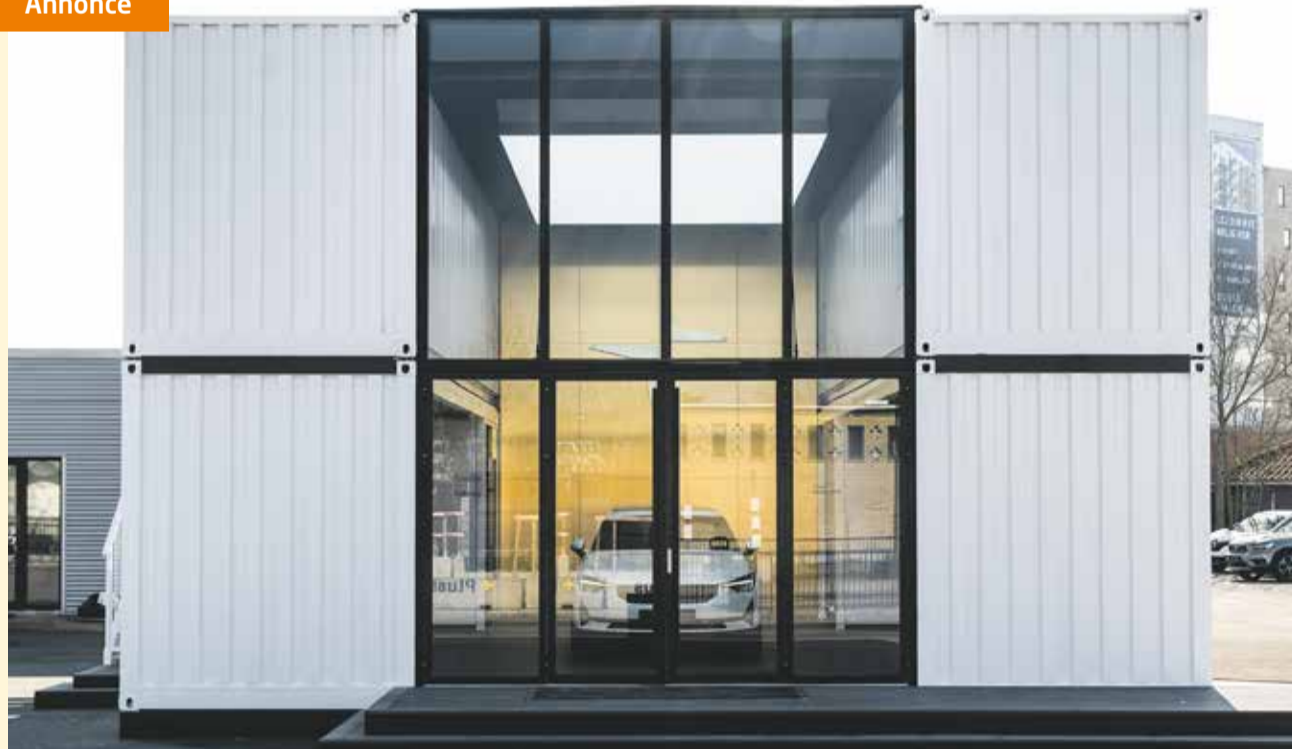
Den nye udstilling er beliggende på Jyllandsgade 22.