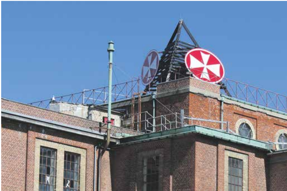
Mon det bliver i den gamle spritfabrik, at Aalborg Teater får adresse i fremtiden.