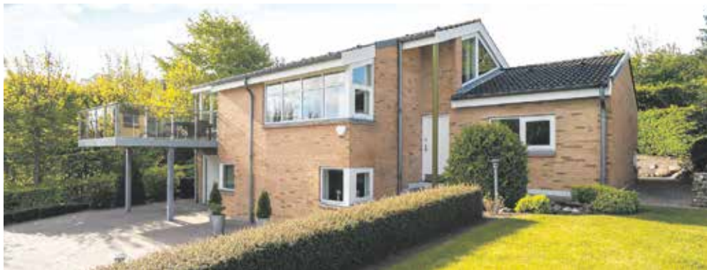
Villaen på Hasserishøj der ønskes ombygget.