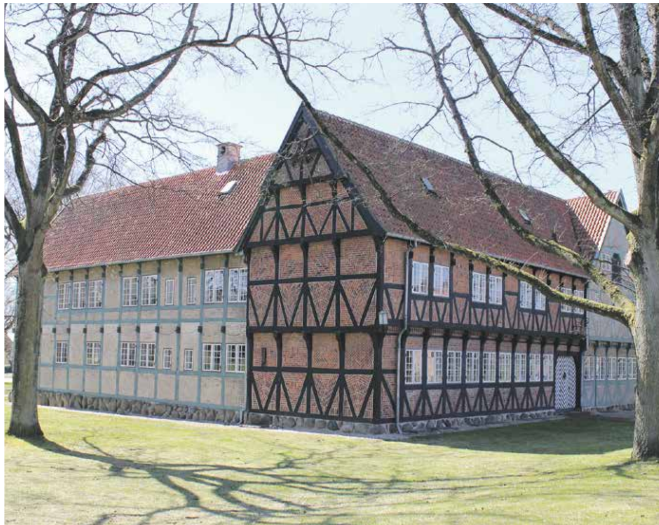
Her ses den karismatiske bygning Svalegården.

Svalegården i Hasseris kan den 15. maj 2022 fejre 70 års dagen for genopførelsen på sin nuværende placering ved Hasseris Kirke.