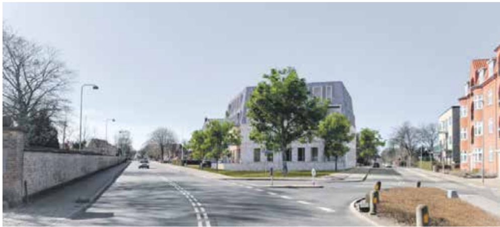
Visualisering af projektforslag sest fra øst. Illustration af N+P Arkitektur.

By- og Landskabsudvalget afviste forvaltningens forslag til ny lokalplan og kommuneplantillæg. Rådmand Jan Nymark Thaysen benyttede derefter sin mulighed for at sende sagen i Byrådet.