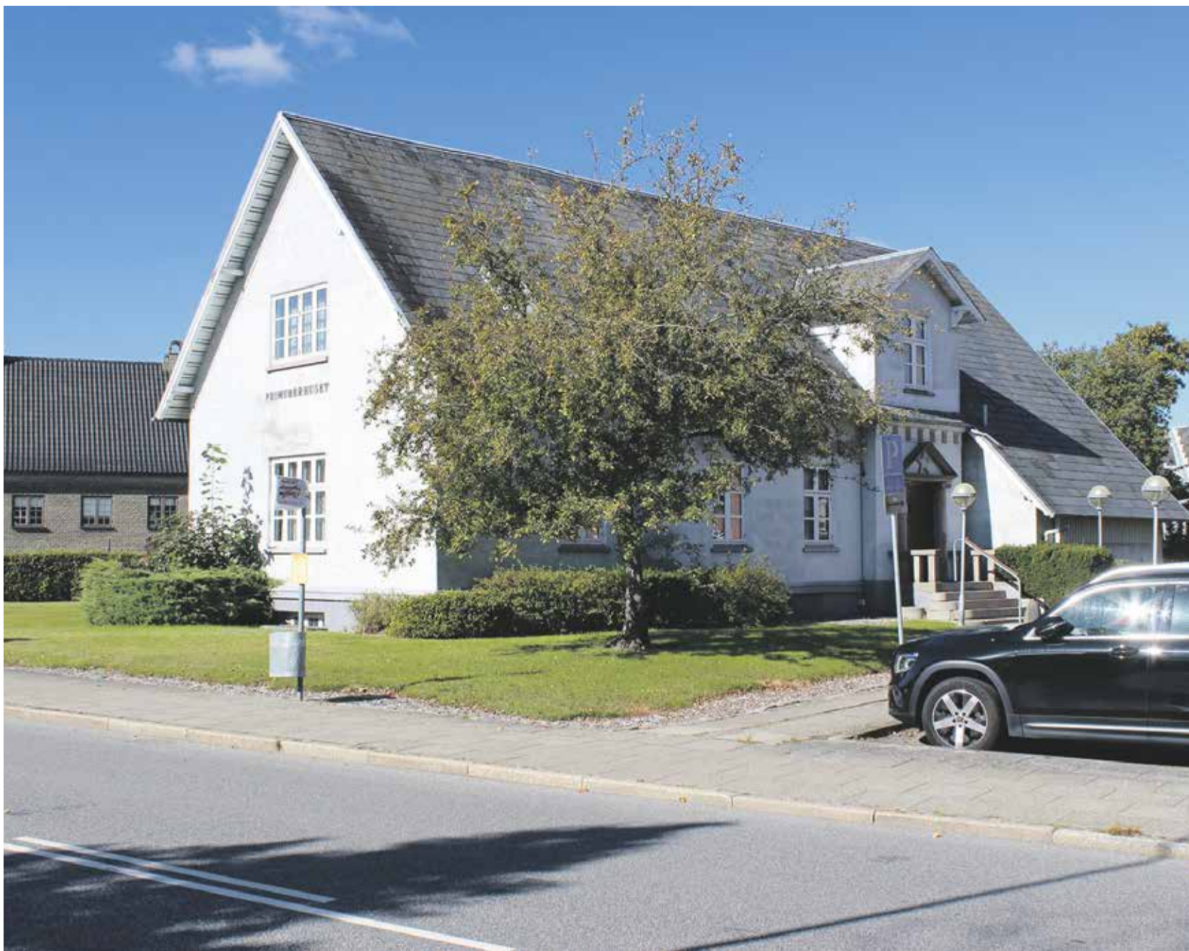
Her ses den eksisterende logebygning.

Men Byrådet har i lignede sager også valgt at sende en sag retur til udvalget, og bede dem revidere det, så et flertal i udvalget kan godkende det.