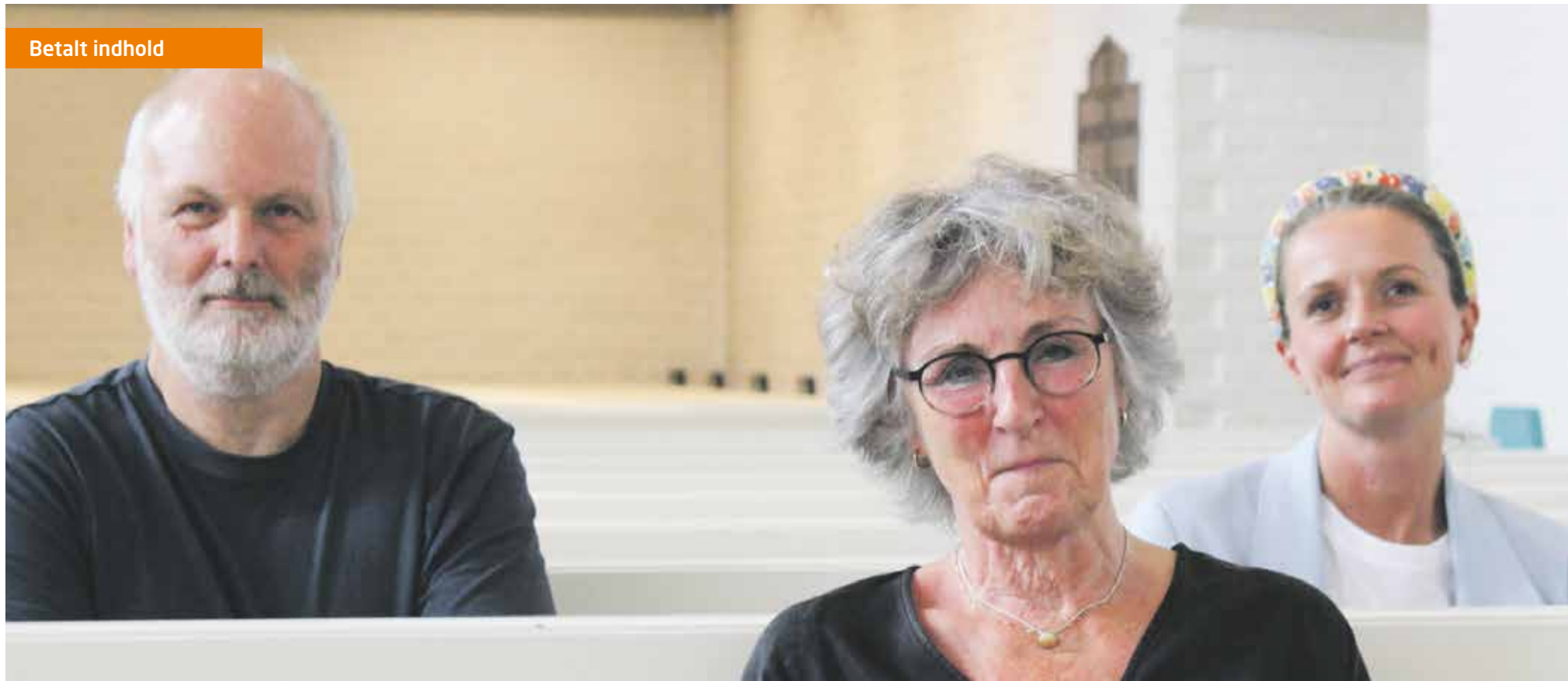
Fællesskabet mellem præster og menighedsrådsmedlemmer er en særlig styrke i Hasseris Kirke, siger de tre.