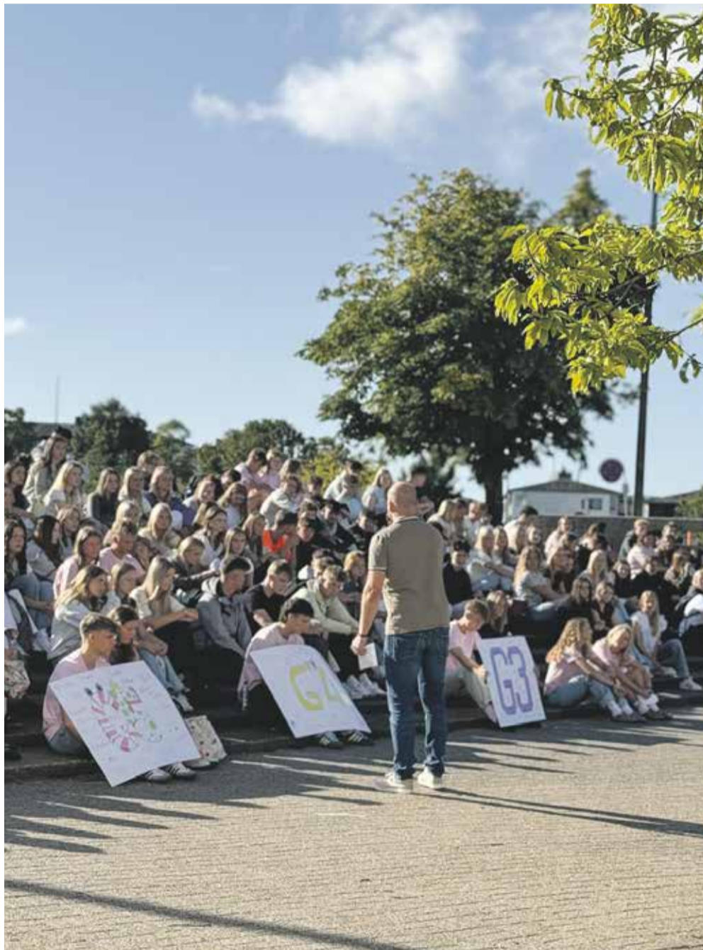
Der bydes velkommen på Hasseris Gymnasium.

Udover Livø-turen vil de første gymnasieuger udover mødet med de forskellige gymnasiefag være spækket med en mængde introaktiviteter, hvor de nye elever bl.a. skal deltage i HG-løb, HG-festival, idrætsdag og 1.g-fest, som alt sammen skal være med til at sikre dem en god start på tre spændende og lærerige gymnasieår