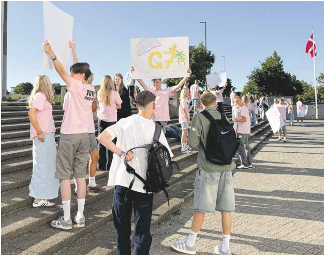
Tutorene stor klar til at tage imod på Hasseris Gymnasium.

252 nye stx-elever og 60 nye pre-IB elever er netop startet på Hasseris Gymnasium og mødt ind til et program spækket med spændende aktiviteter af både faglig og social karakter.