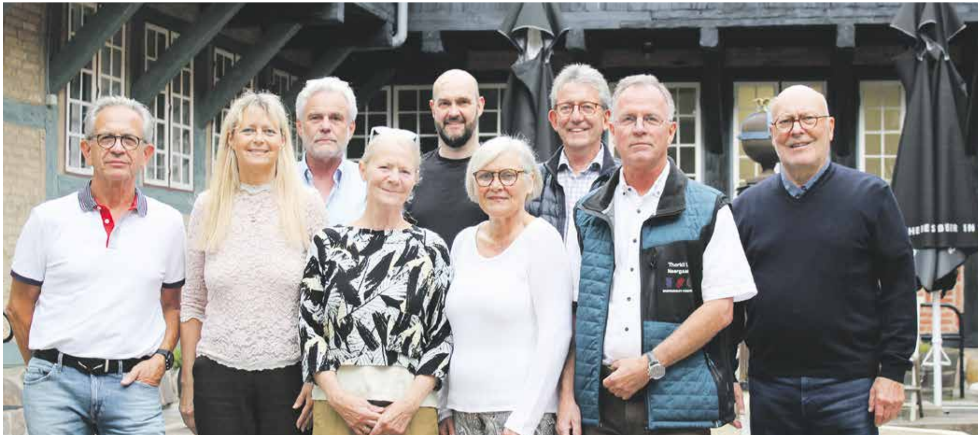
Hasseris Grundejerforening opfordrer alle borgere til at møde op til Vejdirektoratets informationsmøde den 5. september kl. 19.00 i Gigantium.