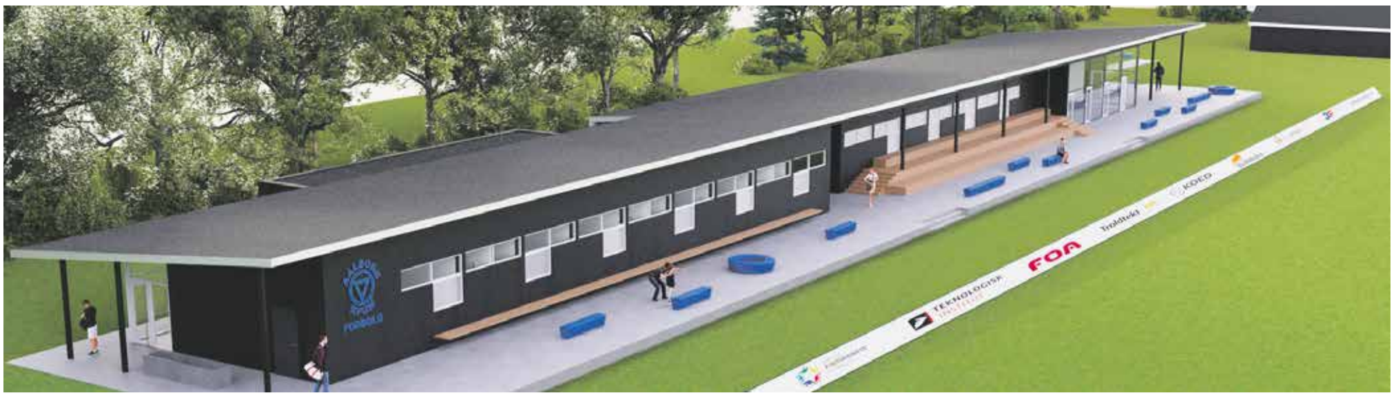
Visualisering af klubhusdrømmene i KFUM Fodbold.