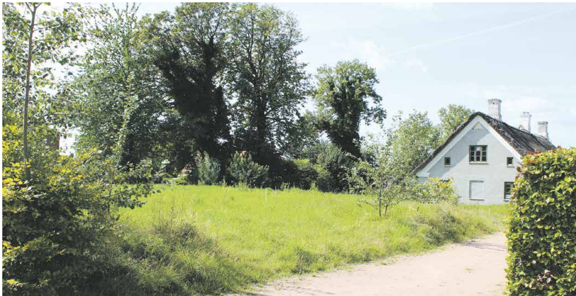
Grunden med den stråttækte bygning som i sin tid husede børnehaven.